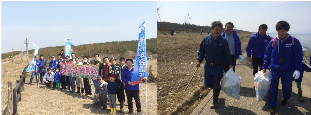
子供から大人までたくさんの方が参加しました

地方創生についての考え方や、行政に頼らないまちづくりについてなど多くの気づきがありました。今年度の私たちのまちづくりにも生かしてければと思います。むつJCのメンバー一同、熱量を上げて今年1年頑張っていきたいと思います！！