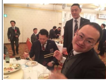
機嫌がいいとこんな顔

長の話もかなりメモを取るほどJCとしてもですが経営者として参考になりました。（感想文の提出がありました）がスラスラ書けました） また、ゼミスタッフの皆様から年間の予定やロードマップの説明があり、塾生の成長を考える熱い思いを感じて帰ってきました。今年のフォーラムで行われる閉講式は三沢の開催となります。できる限り参加し、自分の成長、LOMの成長につなげていきたいと思