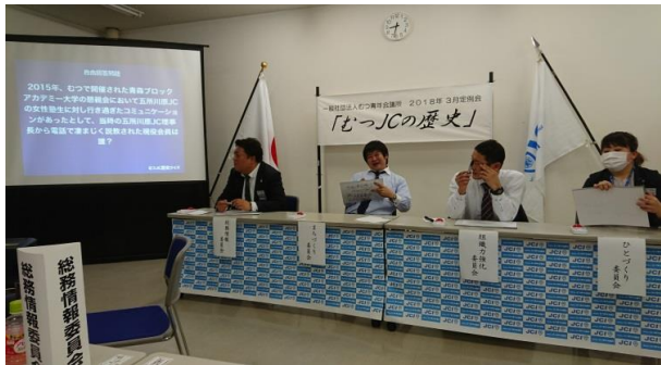
クイズに悪戦苦闘する参加者メンバー