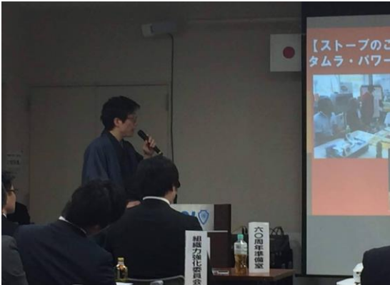
熱弁の後藤先輩と聞き入るメンバー