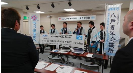
八戸からブロック大会の案内