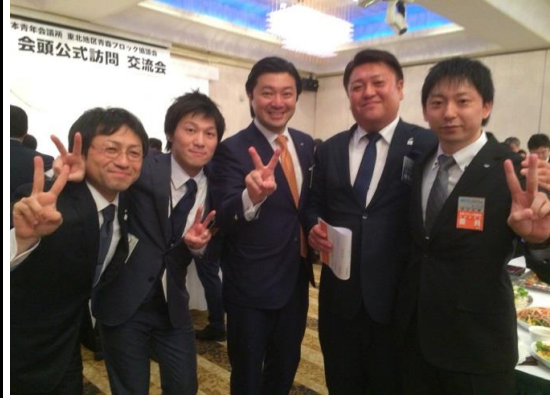
会頭と出席メンバー、特に道川専務が嬉しそうですね

れず挑戦すること・経験することの大切さなどの考え方を聞かせて頂きました。 印象に残っているのはボランティアと青年会議所の活動の違いとして『少年と釣り』という話を聞きこれは会員勧誘で使えるなと思いました。その後の交流会では会頭との名刺交換で、青年会議所の信念を仕事にどのような形で活かしているのか質問し、とても参考になる回答を頂きました。今回の会頭訪問で聞いた事を今後の活動に活かしていければと考えています。