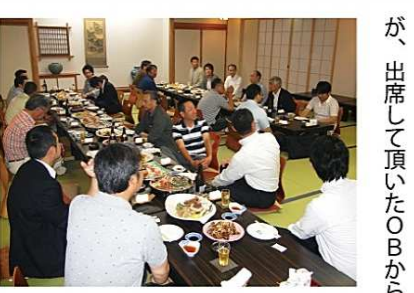
OB & 現役メンバー親睦会の様子

「楽しかった!」「毎月やるべ!」というお言葉を頂き、ホッと致しました。現役メンバーの皆さんはいかがでしたか? 最後に、11名のOBと17名の現役メンバーにご参加頂き、盛會のうちに終えることが出来ましたこと、この場をお借りして御礼申し上げます。ありがとうございました。