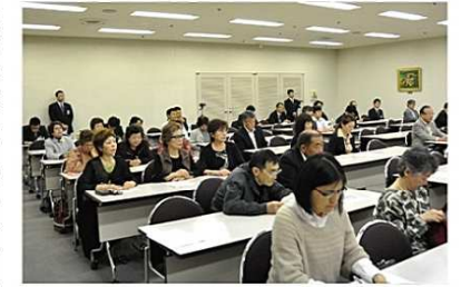
会場の大集會室がほぼ一杯になるほどたくさんの方々にご参加して頂きました。