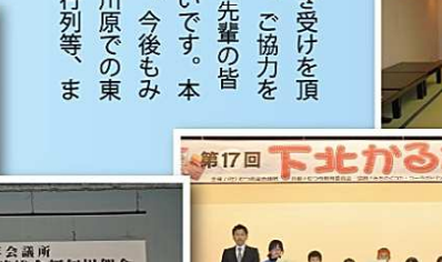
第17回 下北かるた大会