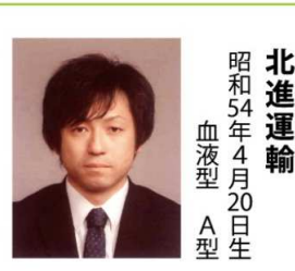
昭和54年4月20日生 血液型 A型

敬愛なる諸先輩の皆様、そして我ら(社)むつ青年会議所会員の皆様、このまだ肌寒さが残る春をいかがお過ごしでしょうか。さて、「一般社団法人格認可申請状況と今後について」ですが、先月の4月24日に電子申請により申請書並びに申請関係書類を提出致しました。そしてつい先日の5月18日に青森県総務部総務学事課の担当者より連絡が入り、現在少しでも早い移行認可を目指し目下「修正並びに訂正」を急ピッチで対応させて頂いております。 今後の予定については、5月末か6月初旬に現在修正並びに訂正を行っている書類を再提出し「答申」が出た後速やかに登記・移行という手筈となります。尚、「答申」が出る時期は現在他団体も続々と申請している状況ですので恐らく今年いっぱいになるのではないかと思います。 以上をもちまして甚だ簡単ではありますがご了承いただき、一般社団法人格認可申請状況と今後についてのご報告と致します。