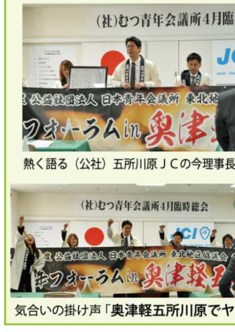
熱く語る(公社)五所川原JCの今理事長

臨時総会終了後には今理事長をはじめとする(公社)五所川原青年会議所のメンバーが、今年9月1日・2日に行われる「東北青年フォーラムin奥津軽五所川原」のPRに来訪されました。(社)むつ青年会議所は東北青年フォーラムの副主管となっております。メンバー全員参加登録しておりますので、是非みんな盛り上げましょう。