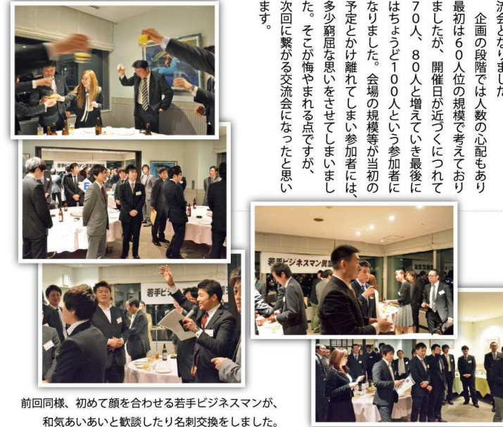
前同様に、初めて顔を合わせる若手ビジネスマンが、和気あいあいと歓談したり名刺交換をしました。

4月20日(金)に第2回若手ビジネスマン異業種交流会を開催致しました。昨年に続き、若手ビジネスマンの交流の場としての開催となりましたが、今回は総勢100名の参加ということで、規模が大きくなりました。また、交流会前に「おでかけ市長室」の開催と、市役所職員、消防員、もろり、署職員、水道企業局職員等の方も参加して頂きました。多種多様な職種の方が一堂に会する、文字通りの異業種交流会となりました。 企画の段階では人数の心配もあり最初は60人位の規模を考えておりましたが、開催日が近づくにつれて70人、80人と増えていき最後にはちょうど100人という参加者になりました。会場規模等が当初の予定とかけ離れてしまい参加者には多少窮屈な思いをさせてしまいました。そこが悔やまれる点ですが、次回に繋がる交流会になったと思います。 当日出会った方には、他の事業にも興味を持ってもらい、また参加してもらえようという青年会議所の魅力を発信していき、できれば会員拡大に繋がるように活動して行きたいと思っております。今回は至らない点がありましたので、次回開催する委員長には、今回よりも更に素晴らしい交流会になる様お願いしたいと思います。