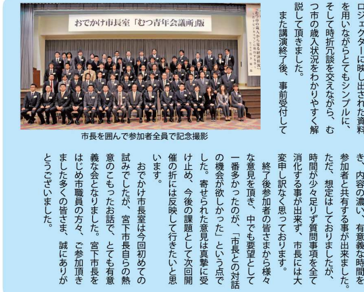
市長を囲んで参加者全員で記念撮影

去る4月20日、第二回異業種交流会に先駆け、おでかけ市長室「むつ青年会議所」版を開催しました。当初は「市長が来たら入集するんじやね」と言っ、不純な動機の元でスタートした企画でしたが、我々JCメンバーも祝賀会等の祝辞等で市長のお話を聞いたことがなく、是非開催して欲しいと多数の声もあり、大変意義のある楽しみな企画へと変貌して行きました。 当日は約100名の参加者でいっぱいとなり、「むつ市の歳入が見える経済状況」若手ビジネスマンに期待する事を演題に、プロジェクトに映し出された資料を用いながらとてもシンプルに、そして時折冗談を交えながら、むつ市の歳入状況をわかりやすく解説して頂きました。 また講演終了後、事前受付して